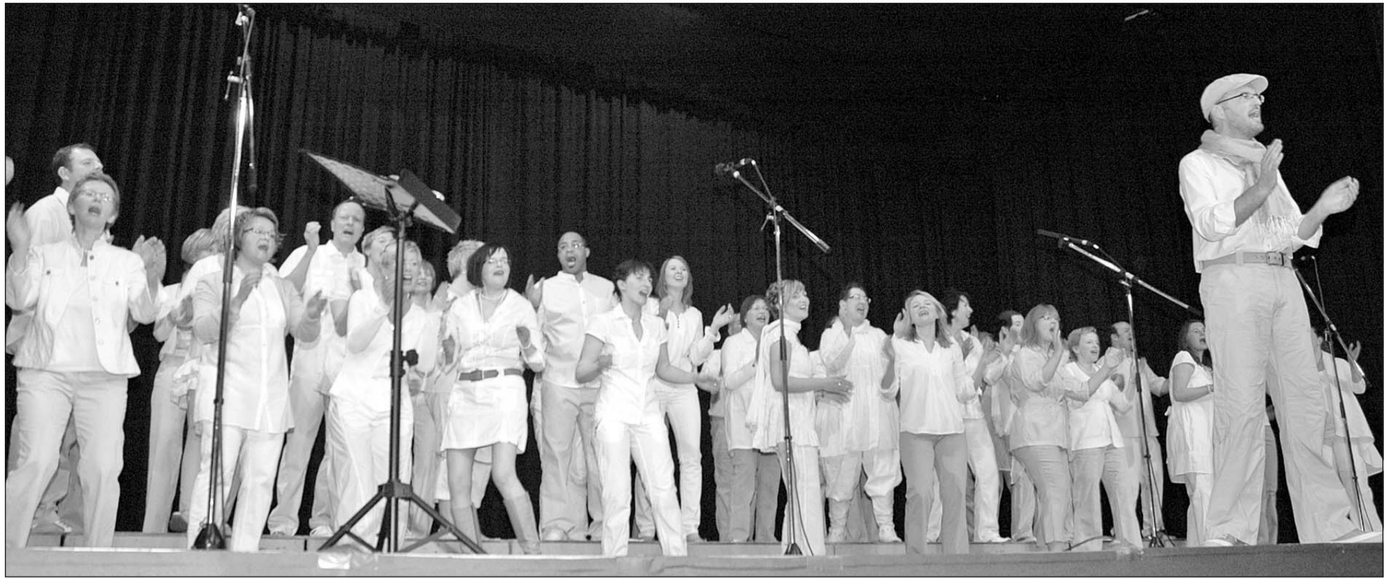
Der erste Auftritt des Popchors »nolimit« in Rheda-Wiedenbrück sorgt für Begeisterung im Reethus: Die Sänger beweisen, dass sie sich ausgesprochen sicher in unterschiedlichen Stilrichtungen wie Rock, Pop und Soul bewegen, sie punkten auch bei Dynamik und Bühnenpräsenz.

Rheda-Wiedenbrück (WB). Reifen zerstochen, Lack zerkratzt: In der Nacht zu Samstag sind am Mühlenwall in Wiedenbrück von Unbekannten bislang sieben Autos erheblich beschädigt worden. Es entstand ein Sachschaden von mehreren Tausend Euro. Die Polizei sucht dringend Zeugen dieser enormen Sachbeschädigung. Hinweise und Angaben dazu nimmt die Polizei in Rheda-Wiedenbrück unter 0 52 42/41 00 24 00 entgegen.